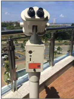
Exemplo de telescópio