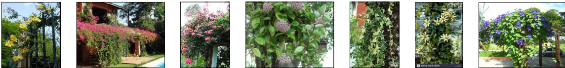
Exemplo de plantas a serem utilizadas no pergolado.

Em caso de divergências entre as cotas dos projetos e suas dimensões em escala, prevalecerão as primeiras. Em caso de divergência entre as especificações e os demais projetos será consultada a fiscalização. Nenhuma modificação poderá ser feita nos projetos, sem aprovação, por escrito, da fiscalização. Em caso de dúvida, quanto à interpretação dos projetos ou destas especificações, serão consultados os técnicos designados pela SEMTUR. Em caso de divergências entre o projeto arquitetônico e os demais, prevalecerá o primeiro. Para especificações referente aos passeios verificar a cartilha de acessibilidade das calçadas de Maceió.