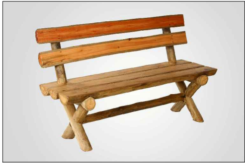
Banco de madeira certificada